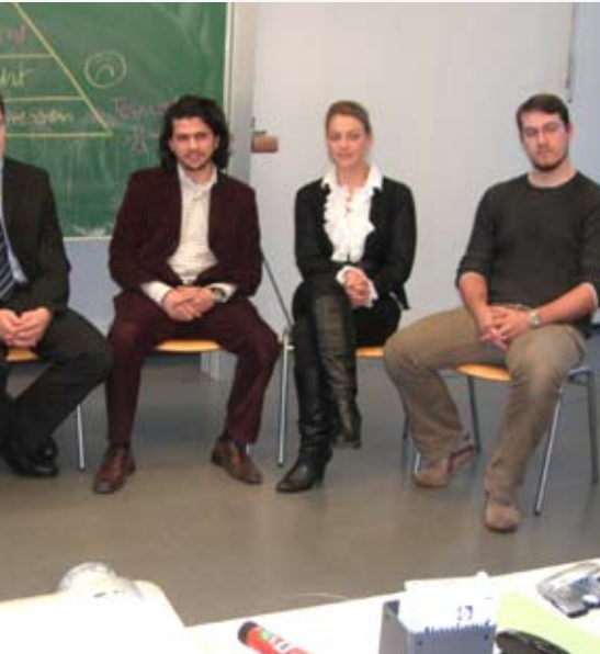
Zusammen arbeiten: Konzept des Studium-Professionale